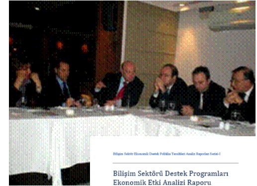
Bilgiye Sektörü Desteklenerek Düşük Politika Teslimleri Analizi Raporları Sektörü